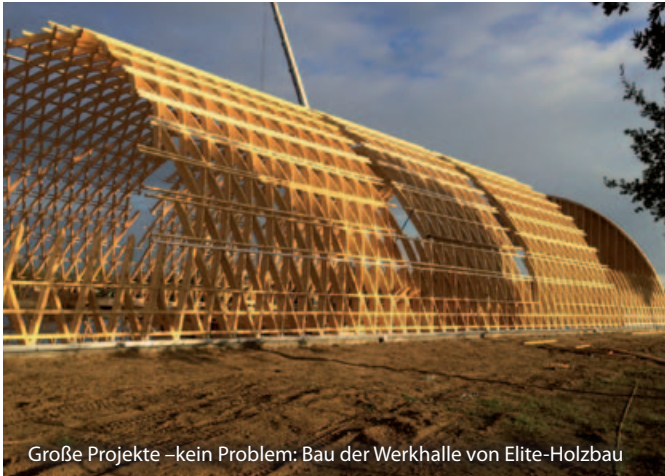
Große Projekte –kein Problem: Bau der Werkhalle von Elite-Holzbau