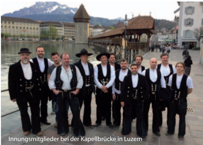
Innungsmitglieder bei der Kapellbrücke in Luzern